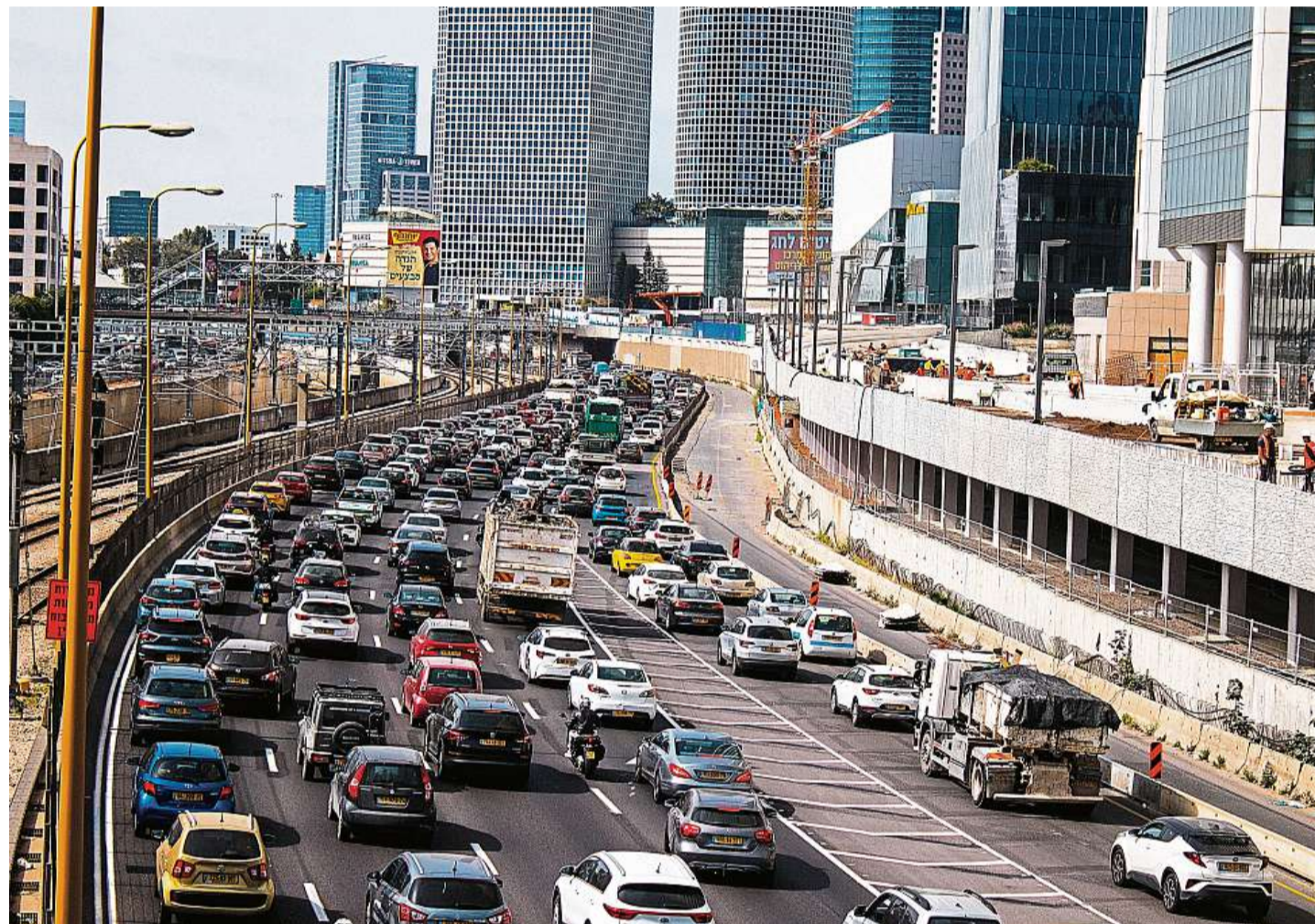
Metropole Ekonomickým a technologickým centrem Izraele je Tel Aviv, jehož celou aglomeraci obývá okolo čtyř milionů obyvatel.

Zbrzdit inflaci, rozeběhnout růst a přilákat investice. To je úkol pro novou vládu Izraele, který kvůli radikálům nemusí uspět.